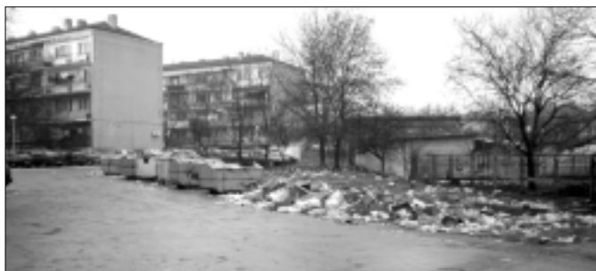
В последните години в Езерово и Страшимирово няма нито един съставен акт за незаконно изхвърляне на боклук извън определените за това места.

По предложение на общинската администрация Общинският съвет намали такса битови отпадъци и данъка върху недвижимите имоти. С промяната се цели да се компенсира увеличението с 50 процента на данъчните оценки на имотите след последните промени в Закона за местните данъци и такси, за да не се натоварват гражданите допълнително, посочиха от общината. На база на данъчните оценки се изчисляват дължимите данък върху недвижимите имоти и такса смет. Таксата за битови отпадъци за физическите лица от 2,6 промила за 2008 г. става 2,2 промила за 2009 година. За юридическите лица тя остава непроменена - 9,84 промила. Размерът на данъка върху недвижими