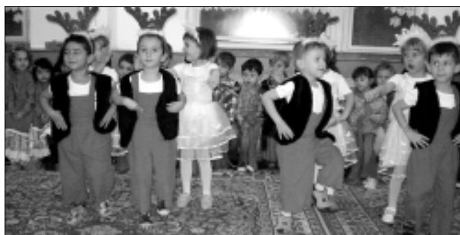
Коледни тържества имаше във всички детски градини в общината.