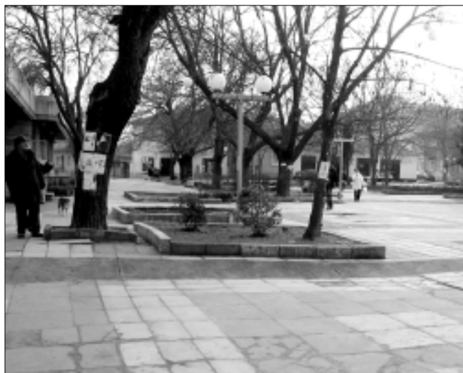
Централният площад на Белослав ще се промени напълно, ако общинският проект за модернизирание на градската среда спечели одобрение от ЕС

бъде направен красив фонтан, който да радва хората. В парка ще има нови алеи и ново залесяване. Проектът включва още преасфалтиране на улици и паркинги, оправяне на тротоари и 5 детски площадки в квартал „Младост“, подмяна на уличното осветление с енергоспестяващи лампи, озеленяване. Уличните ремонти ще обхванат 5 улици и 3 локал-