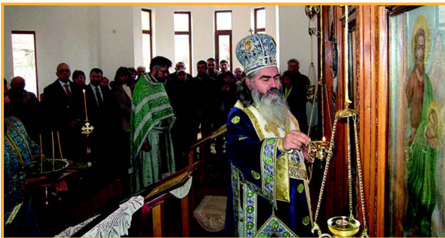
Ден след Никулден беше открита новопостроена църква „Св. Николай Чудотворец“ в Страшимирово. Тя беше осветена от Варненския и великопреславски митрополит Кирил (вдясно).