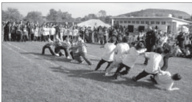
Ученици от начален курс премериха своите умения в състезанието „Бързи, смели, сръчни“. Те скачаха с чували, дърпаха въже, бягаха с яйце в лъжица. Първи в игрите се класира отбор „Делфин“ на ОУ „Св. св. Кирил и Методий“ - с. Езерово, следвани от отбор „Ракета“ от НУ „Отец Паисий“.