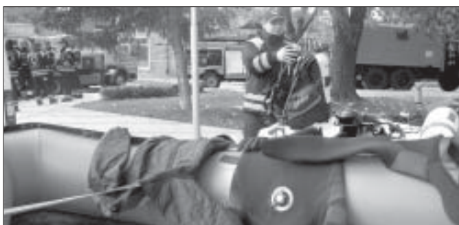
Гражданска защита показа в Белослав техника, специализирани автомобили и лодки за аварийно-спасителни дейности по суша и вода