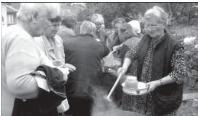
Навръх Димитровден с празнична света литургия беше отбелязан храмовият празник на църквата „Св. Димитър Солунски“ в Белослав. След службата по традиция на дошлите миряни беше раздаден курбан за здраве и благополучие.