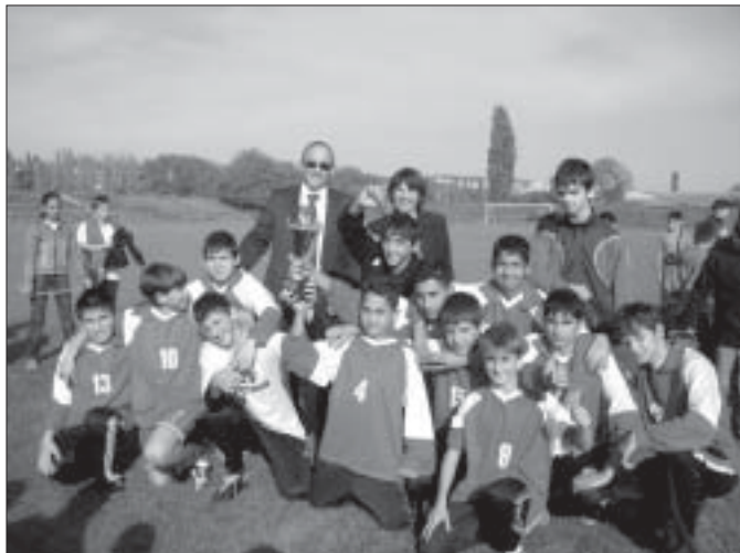
Първият футболен турнир за купата на кмета на Белослав се проведе по повод празника на града. Участваха 4 училищни отбора. Първото място и купата на кмета спечелиха футболистите от СОУ „Св. св. Кирил и Методий“ (на снимката вляво), които на финала отстраниха отбора на ОУ „Св. Патриарх Евтимий“.